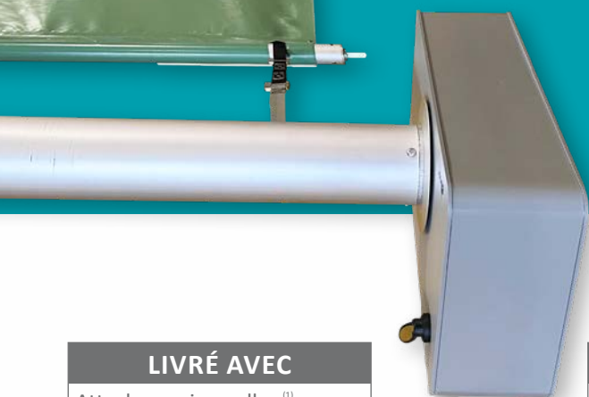
Attache universelle (1)